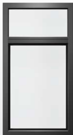
Top 90 Nova-line KAB, buitenaanzicht